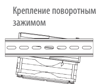
Крепление поворотным зажимом