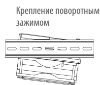
Крепление поворотным зажимом